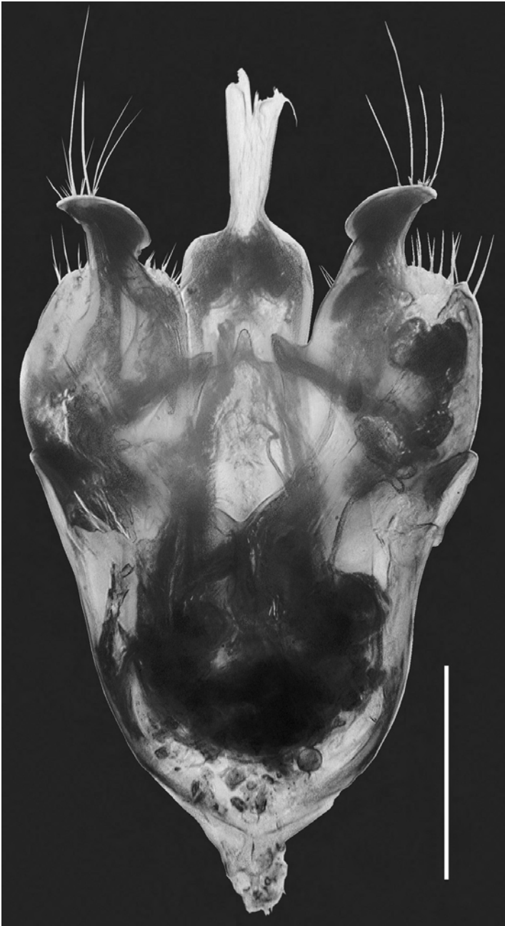
Figura 5. Edeago de Gastrallus mauritanicus Español, 1963 del arroyo Valdeinfierno, Parque Natural de los Alcornocales (Los Barrios, Cádiz). Escala = 0,1 mm.